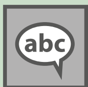
Geen moeilijke termen