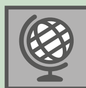
Wereldwijde spreiding voor iedereen